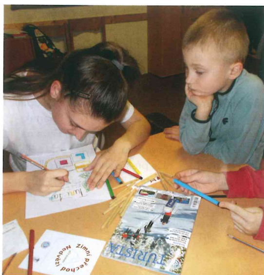
Kralupští tomíci si připomněli 130 let časopisu Turista